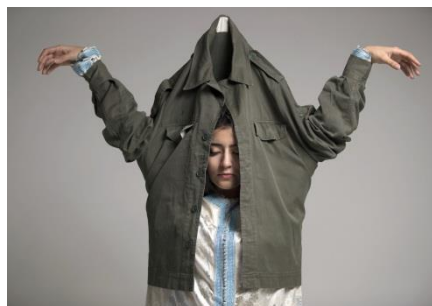
Madiha Sebbani, Hanged , 2017 Fotografie auf Dibond, Edition: 3/5, 100 x 80 cm