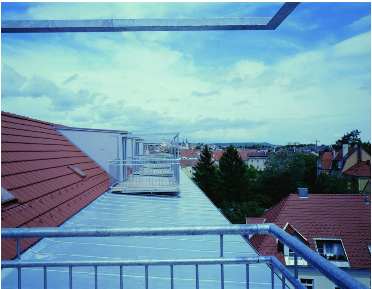
Atelierwohnungen von AIR – ARTIST IN RESIDENCE Niederösterreich