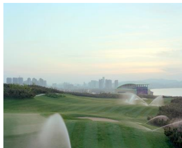
Jiehao-Su, Borderland , 2012-15