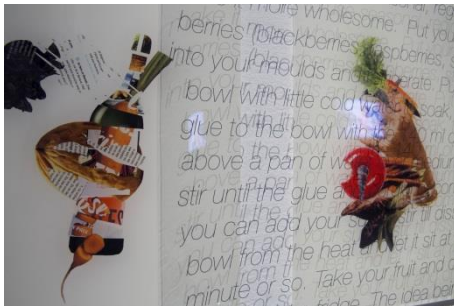
Ksenia Yurkova, Spinebone and Stuffed Rabbits , 2018 Ausstellungsansicht The Project Room Gallery , Helsinki