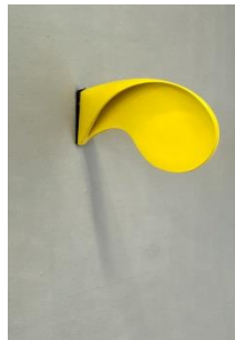
Elmira Irvanizad, Objekt Nr. 6 , 2017 Lackierte Keramik und Metall, ca. 35 x 20cm