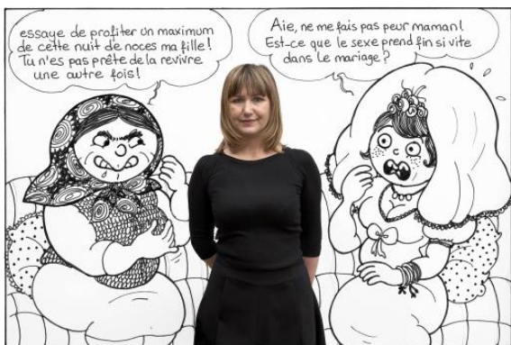
Ramize Erer