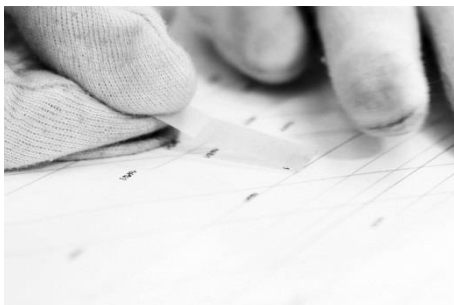
Lucía Simón Medina, The name on the tip of the tongue , 2017